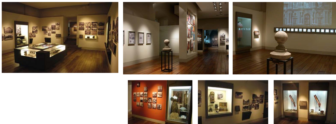
Remodelación salas del S. XX. Museo Histórico Nacional. 2006 Investigación y guión expositivo: Leonor Castañeda , Gabriel Valdés, Ramón Castillo, Diseño Museográfico y realización: Sebastián De la Fuente. Diseño grafico: Gabriel Valdés Montaje de la colección: Leonor Castañeda .