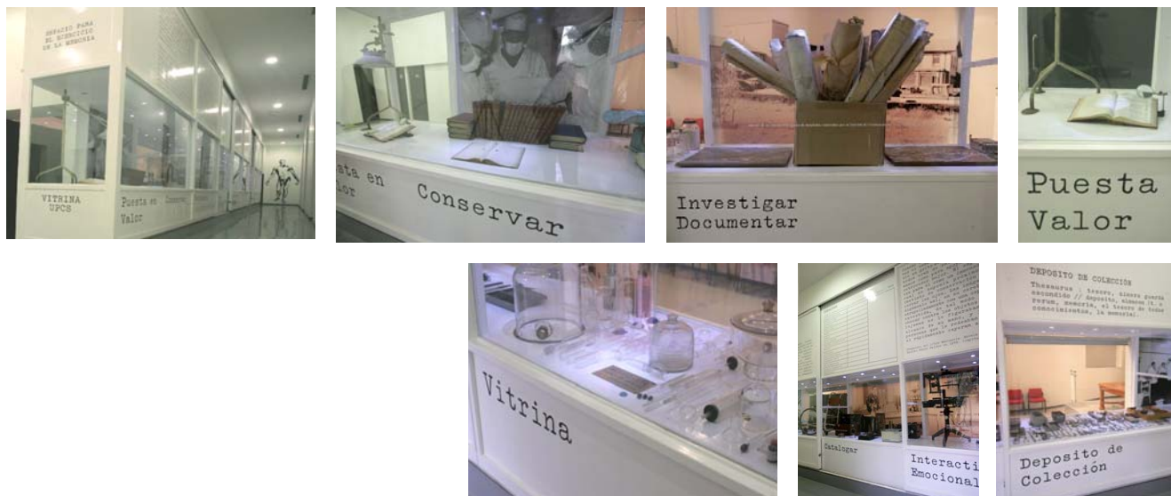
“Espacio para el Ejercicio de la Memoria”. El estado “cero” de la colección. Primera exposición realizada en la vitrina del Centro Nacional de Recuperación Patrimonial de la Unidad de Patrimonio Cultural de la Salud, MINSAL, 2009. Desarrollo conceptual, guión expositivo, diseño museográfico y montaje: Leonor Castañeda .